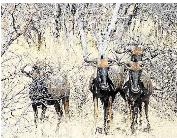
Brave Tiere: Gnus bewegen sich ordentlich in Reih und Glied. Gut für die Zähler, die den Bestand notieren müssen.

>> K.D. Kieser ist Kleintierärztin in Garmisch-Partenkirchen.