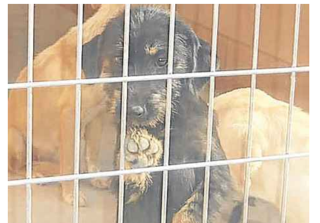
Auf einer spanischen Tötungsstation verbringen die Dackel Sira, Mona und Canuto ihr Dasein. Sie brauchen ein Zuhause.

Weitere Informationen gibt es auf tierfreunde.de .